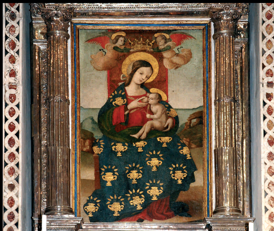
Madonna di Custonaci - Madonna von Custonaci