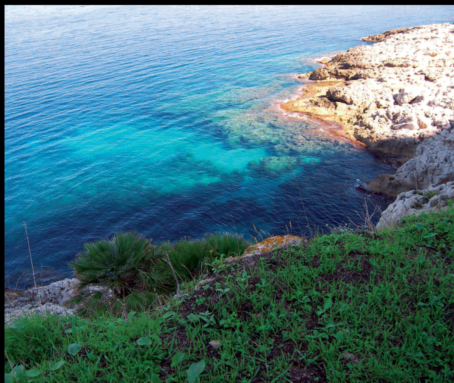
RNO Monte Cofano - RNO Naturschutzgebiet Berg Cofano