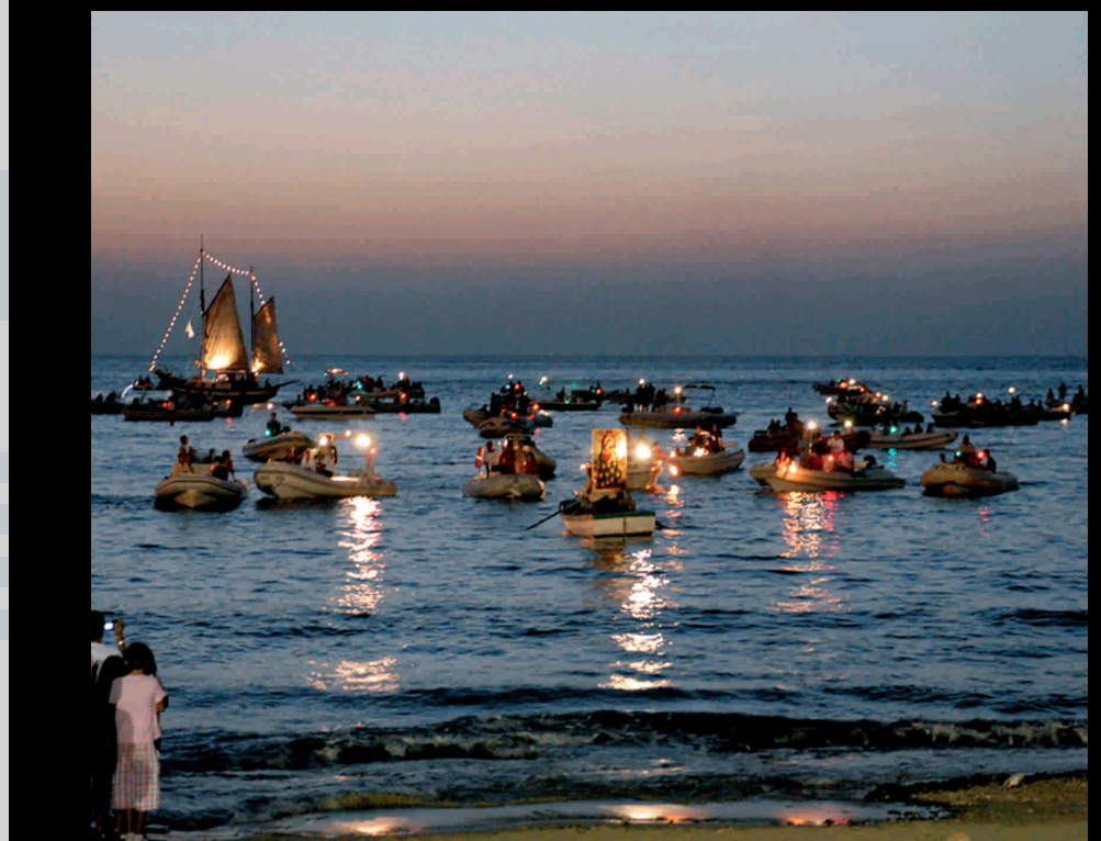
Processione Madonna di Custonaci - Prozession der Madonna von Custonaci

Extra circuito-Stationen in der Umgebung: Tonnara di Cofano Tonnara di Cofano Resti dell'impianto a terra di un'antica tonnara, attiva fin dal XV secolo Tonnara di Cofano Überreste einer alten Fanganlage an der Küste für Thunfische, seit dem 15. Jh. in Betrieb