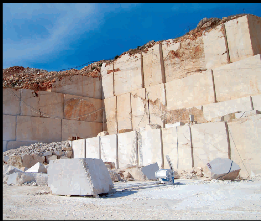
Cave di marmo - Marmorsteinbrüche